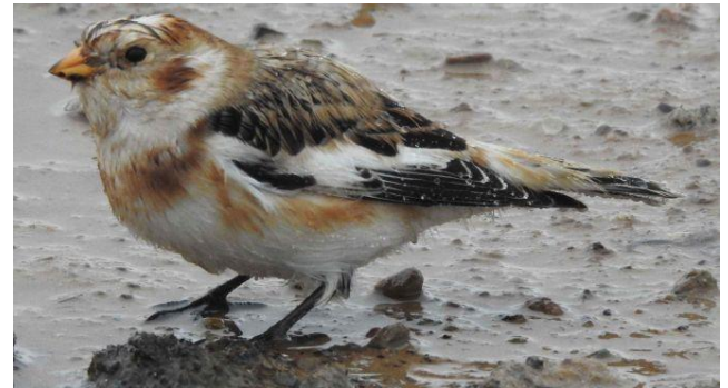
Schneeammer im Regen bei Varenholz