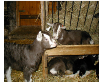
Einige unserer Lämmer