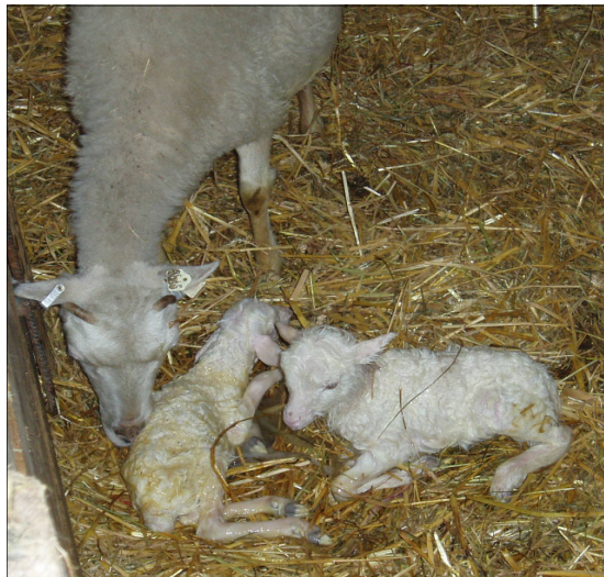
Zwei neu geborene Skuddenlämmer

Bisher keine Verluste durch den Schmalenberg- Virus in der Stationsherde