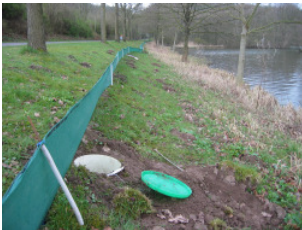
Amphibienschutzzaun am Schiedersee