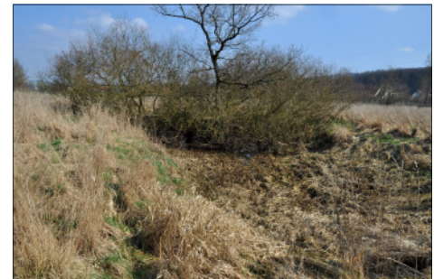
Tränklöcher bei Harzberg 1994 und 2012