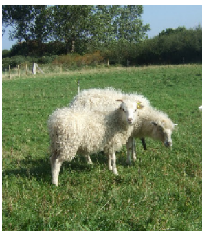
Zwei Skudden auf Hiddensee.

Der Grundstock für eine vitale Skuddenherde auf Hiddensee ist somit vorhanden.