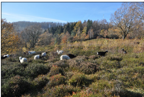
Skudden auf der Bergheide auf der Vogeltaufe.