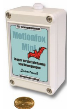
Bewegungsmelder mit Infrarot-Sensoren ermöglichen störungsfreie Langzeituntersuchungen.