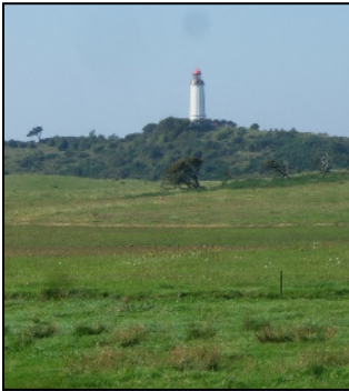
Leuchtturm auf dem Dornbusch - ein Wahrzeichen von Hiddensee.

Im Jahr 2012 haben wir von dem Verkauf von 60 Zuchttieren nach Litauen berichtet. Auch im Mai 2015 konnten wir wieder 20 Mutterschafe in die Ferne verkaufen.