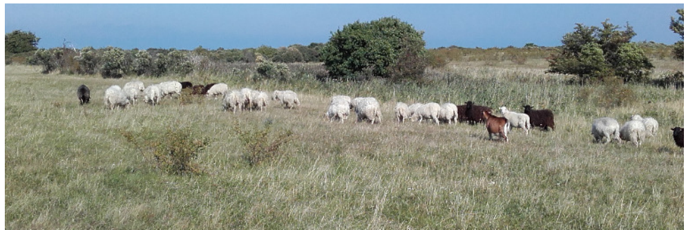
Skudden und eine Ziege in völliger Freiheit im 28 ha großen Weidegebiet auf Alt-Bessin.