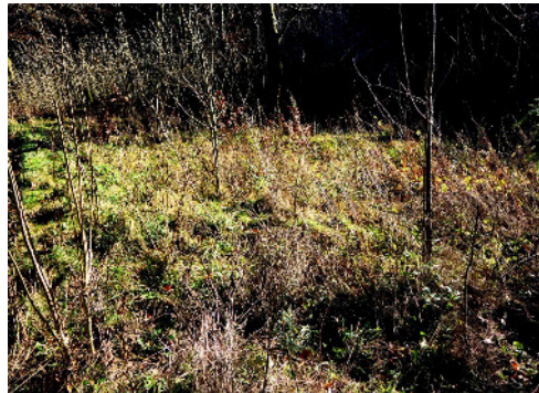
Hätten Sie hier nach Libellen gesucht? Winterlebensraum der Winterlibelle.