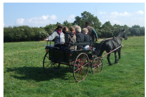
Anreise mit der Kutsche auf der autofreien Insel.