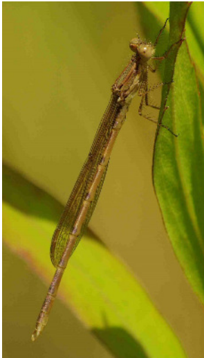
Frisch geschlüpfte Winterlibelle

Bereits im April werden die Fortpflanzungsgewässer aufgesucht. Frisch geschlüpfte Libellen wurden in diesem Jahr an Abtragungsgewässern in der Werreauce beobachtet.