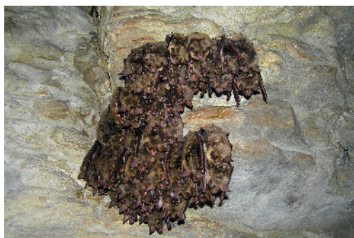
Die Cluster-Bildung zeigt die zunehmende Aktivität an.

Ab Mitte März erfolgen dann bis in die Eingangsbereiche und darüber hinaus reichende Erkundungsflüge. Die hierbei erzeugte Unruhe trägt zur Synchronisation des Ausfluges bei.