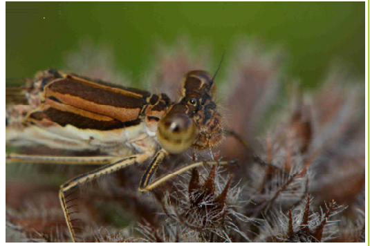
Portrait einer Winterlibelle. Im Frühjahr werden die Augen blau.