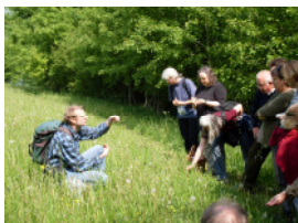
Exkursion im Gelände