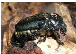
Eine Rarität—der Eremit

Dies tut Not, denn mehrere Bäume, die noch vor wenigen Jahren als Entwicklungsstätten dienten, sind heute aufgrund fortgeschrittenen Zerfalls verwaist.