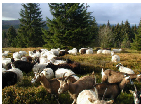
Pflege der Bergheide auf der Velmerstot