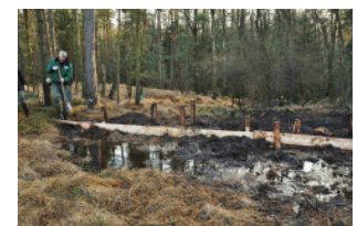
Erste Effekte sind sichtbar

Umsetzung des Maßnahme- paketes Hiddeser Bent