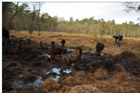
Fertige Spundwand—im Hintergrund der höher liegende Hochmoorbereich