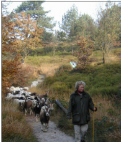
Nach dem Auftritt: unsere Schäferin mit der Herde.

Gerade als die Flächen abgeweidet und unsere Tiere wieder im Tal waren, fragte ein ARTE-Fernsehteam an, ob unsere Tiere nicht in einem Film über die Naturschönheiten im Bereich der potentiellen Nationalpark-Kulisse tragende Rollen übernehmen könnten..