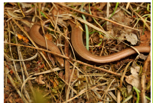
Sieht zwar so aus, ist aber gar keine richtige Schlange, die noch häufige Blindschleiche

Impulse aus dem Ehrenamt beeinflussen und bereichern die Arbeit der Station