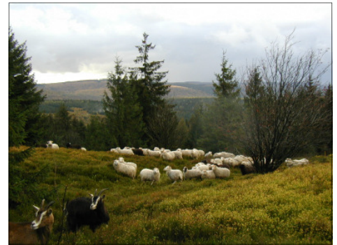
Unsere Herde auf der Velmerstot

Hoffentlich mit vielen Schafszenen— damit sich der Aufwand auch gelohnt hat!