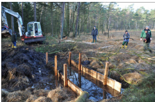
Doppelschalige Spundwände—der Zwischenraum wird anschließend verfüllt

Nach der Entbuschung (vgl. Stationsnachrichten Nr. 2), konnte so ein weiterer Baustein der gemeinsam mit der Unteren Landschaftsbehörde des Kreises Lippe und dem Landesverband Lippe konzipierten Maßnahmen zur Revitalisierung des Hiddeser Bentes realisiert werden.