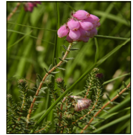
Glockenheide— Zeigerart intakter Moore

letztes Rückzugsgebiet gefunden. Gleichwohl ist auch dieses Kleinod unter unseren Naturschutzgebieten durch zunehmende Verbuschung und Abtrocknung gefährdet. Der Klimawandel mit stark zurückgehenden Niederschlagssummen im Sommerhalbjahr macht auch vor unserem letzten Hochmoor nicht halt.