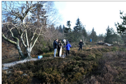
Dreharbeiten mit ARTE

Ein historisches Bild, aber so sah es auch 2011 aus.