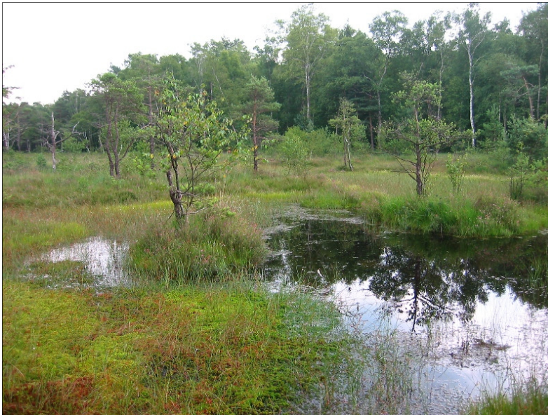
Bald Vergangenheit? Wassergesättigter Hochmoorbereich

Um so wichtiger sind Maßnahmen zur Verbesserung des Wasserhaushaltes des nach Südwesten hin abfallenden Moores.