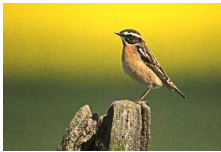
Bild aus 1997, Mossenberg, NABU-Gebiet am Hainbach/Kammerwiesen Mit DSLR und Spiegeltele 11/1000 mm auf Fujichrome 100

Es wäre schön, wenn wir einen Brutnachweis fotografisch dokumentieren könnten.