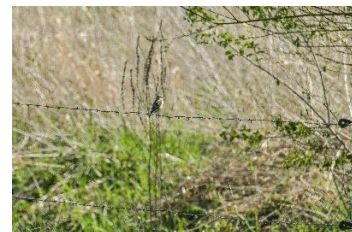
1+2:Industiepark Lippe / Belle am Regebrückhaltebecken 3:Mossenberg, NABU-Gebiet